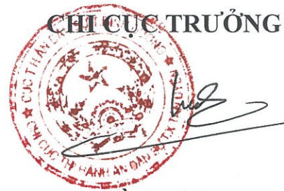
Hồ Quý Sơn